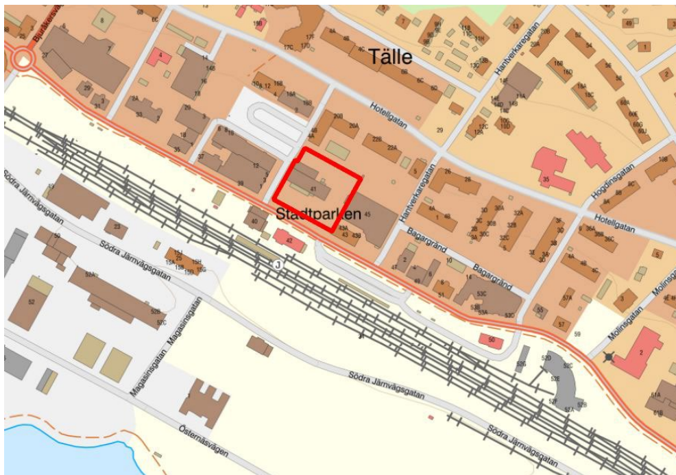
Kartbild: Översiktsbild över planområdet