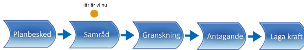
Ovan: Schematisk bild över planprocessens olika steg